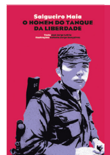
Salgueiro Maia O Homem do Tanque da Liberdade José Jorge Letria

Salgueiro Maia — o Homem do Tanque da Liberdade , além da biografia de um herói nacional, é também uma lição sobre um dos acontecimentos mais marcantes da história portuguesa contemporânea — a Revolução dos Cravos. Em vez de balas, que matam, havia flores, cravos vermelhos, por todo o lado, significando o renascer da vida e a mudança.